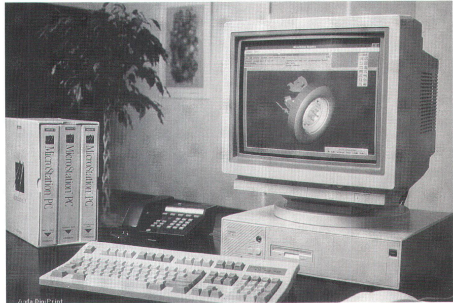
Intergraph-PC 433 mit installierter CAD-Software Microstation.