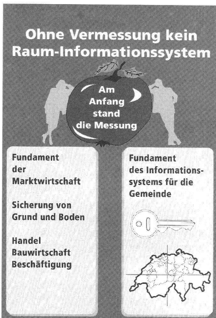
Abb. 9: Die Vermessung, das Fundament der Marktwirtschaft und der Informationssysteme.

ner Schadenstypen, mit und ohne Kostenzusammenstellung und vieles mehr). Mit diesem einfachen Beispiel ist es bereits möglich, ein effizientes Management der Strassenerhaltung vorzunehmen.