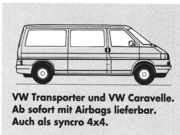
VW Transporter und VW Caravelle. Ab sofort mit Airbags lieferbar. Auch als syncro 4x4.

Natürlich könnten wir anstelle der zwei Buchstaben unsere innovativen Vorteile ins Rampenlicht rück-