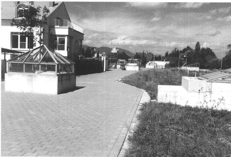
Abb. 1: Oberönzfeld.

Baufelder fest, auf denen die Gebäude errichtet werden können. Die Lage und Grösse der Bauten sind nicht definiert. Einzig der Zweck der Bauten und die Geschosshöhe sind festgelegt. Um die minimal geforderte Ausnutzungsziffer zu garantieren, sind bei den Höfen die Mindestzahl der Wohneinheiten und bei den Wohnblöcken die minimale Bruttogeschossfläche festgelegt. Gerechnet wurde mit 109 Wohnungen und ca. 285 Einwohnern.