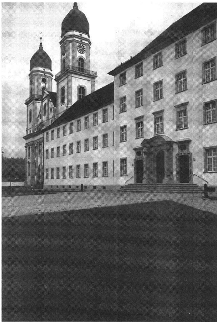
Abb. 2: Kloster St. Urban.

Das Kloster St. Urban wurde vor 650 Jahren von Zisterziensermönchen erbaut. Der heutige Gebäudekomplex stammt aus dem 18. Jahrhundert und ist im Barockstil gehalten. Im Jahre 1845 wurde das Kloster aufgehoben und die Mönche verliessen den Ort. Später wurde in den Gebäulichkeiten eine psychiatrische Klinik eingerichtet.