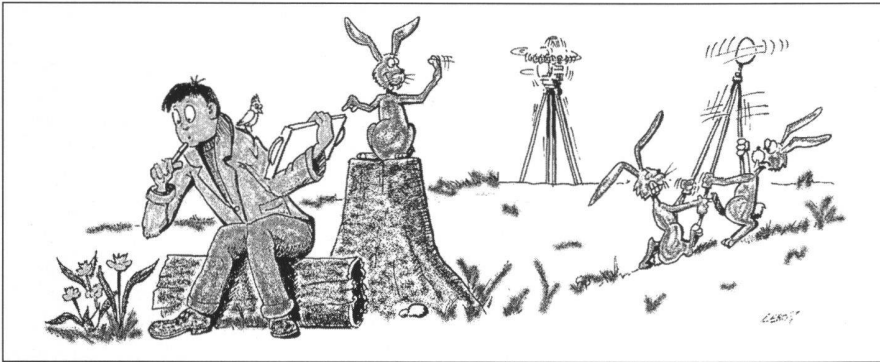
Fig. 1: Levé numérique intégré. Le théodolite est robotisé et poursuit automatiquement la cible, un prisme réflecteur qui doit être placé au-dessus de l'objet à lever. Les coordonnées sont reportées automatiquement sur l'écran de l'opérateur, qui peut vouer son attention aux caractéristiques intrinsèques de l'objet visé (attributs), ainsi qu'à ses relations avec son environnement (topologie).

une orthophotographie numérique (cela pour au moins deux raisons: premièrement, c'est utile pour se repérer; deuxièmement, l'interaction avec la photogrammétrie fait très plaisir à mon collègue Otto Kölbl!).