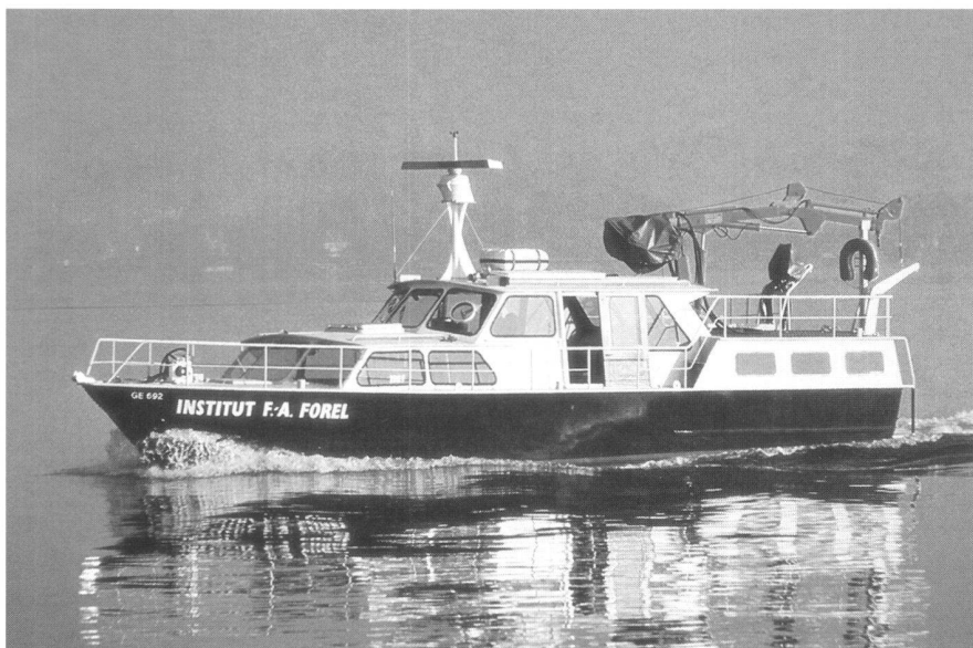
Fig. 3: «La Licorne», vaisseau de recherche de l'Institut Forel. Grâce à un système multi-antennes GPS, on pourrait déterminer simultanément la position, l'orientation et les angles d'inclinaison du bateau (roulis et tangage). Ainsi le point d'impact du faisceau de l'échosondeur au fond du lac pourrait être déterminé avec précision.

Avec les méthodes satellitaires, il faut capter les mêmes satellites aux deux extrémités d'un vecteur à mesurer, mais il n'est pas nécessaire de voir d'un repère à l'autre; on peut donc abandonner les sommets des montagnes. Nous avons établi des points fixes en des endroits accessibles et, dans un premier temps, nous les avons rattachés à l'ancien réseau. Les récepteurs sont très sophistiqués, mais leur utilisation est simple et les collaborateurs locaux peuvent être impliqués rapidement,