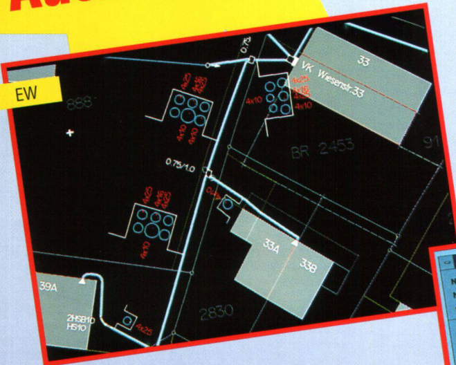
Gas / Wasser