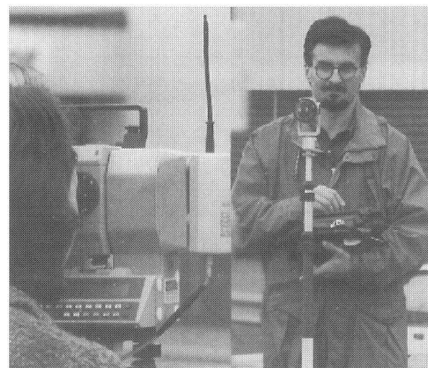
Anwendungsbeispiel: Totalstation-Vermessungspunkt (Detail).