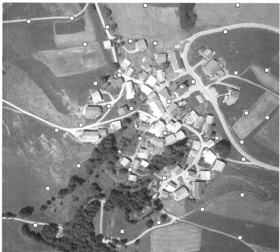
Abb. 2: Signalisierte Punkte im Testgebiet Urmein (als Quadrate nicht massstäblich im Bild gekennzeichnet). Ausschnitt aus einem UMK-Photo.

Die Bildflugdaten sind in Tabelle 2 zusammengefasst. Die Flughöhe über Grund betrug ca. 360 m, was einen Bildmassstab von 1:20 000 ergibt. Der Bildflug wurde mit einem Helikopter der Helibernina durchgeführt und dauerte ohne An- und Abflug ca. 30 Minuten. Es wurden insgesamt 11 Streifen geflogen, davon 9 Streifen mäanderförmig in Nord-Süd-Richtung und 2 Streifen in Ost-West-Richtung. Für die 50 Aufnahmen wurde die Kamera durch den Operateur aus dem Helikopter gehalten. Beim Bildflug sind folgende Probleme aufgetreten. Wegen des kleinen Streifenabstandes (ca. 50 m) liess sich der Helikopter schwer nach dem Bildflugplan navigieren, wodurch sich die geplante Quer- bzw. auch Längsüberdeckung von 70% schwer