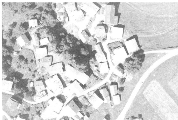
Abb. 3: Grauwertbild der Kodak DCS200.

Im Vergleich zu den Ergebnissen mit der DCS200 ist die Genauigkeit aus Kontroll-