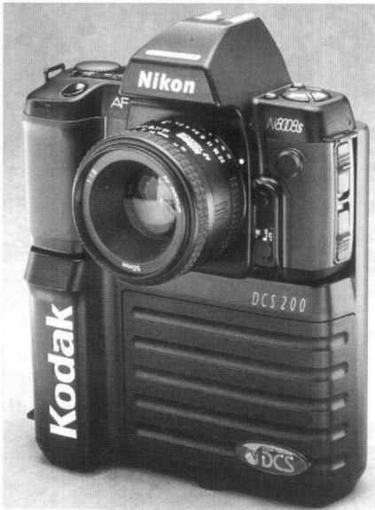
Abb. 1: Kodak DCS200.

wird die Signalisierung und der Bildflug beschrieben, während in Kapitel 4 die Ergebnisse der Auswertungen zusammengefasst werden.