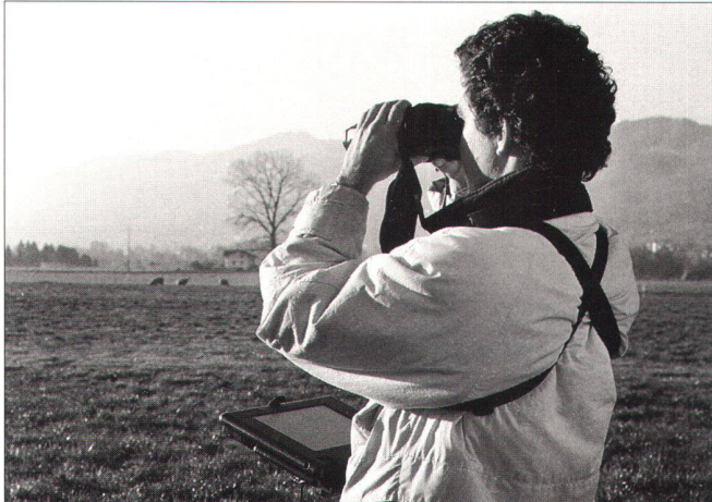
Felddatenerfassung mit Leica Vector GIS.

Objektbeschreibungen durch thematische, geometrische und räumliche Informationen bilden die Basis aller geographischer Informationssysteme. Mit dem Messfernglas «Leica Vector» steht nun für die Erfassung dieser Informationen ein effektives Werkzeug zur Verfügung. Die im Produkt vereinigten Instrumente Fernglas, Kompass, Entfernungsmesser und Neigungsmesser erleichtern die dreidimensionale Datenaufnahme im Feld für eine Vielzahl von Anwendungen im Meter-Genauigkeitsbereich wie Forstwirtschaft, Inventar-Management von Versorgungsunternehmen und Kommunen, Ökologie- und Umwelt-Ressourcenmanagement, wissenschaftliche Felddatenerfassung etc.