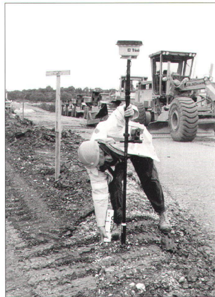
Trimble GPS-Rover 4800 (AGNES = Automatisches GPS-Netz Schweiz)

Obstgartenstr. 7, 8035 Zürich, Tel. 01 363 41 37, Fax 01 363 06 22, allnav@allnav.com, www.allnav.com Baden-Württemberg: 71522 Backnang, Tel. 07191 73 44 11, Bayern: 83646 Bad Tölz, Tel. 08041 79 97 50