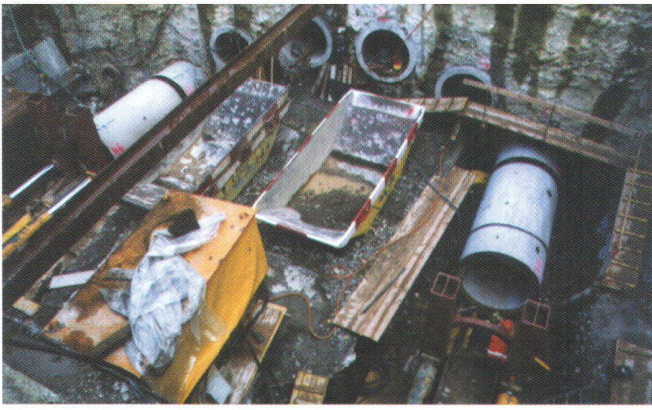
Abb. 8: Rohrschirm Meinrad Lienert-Platz.