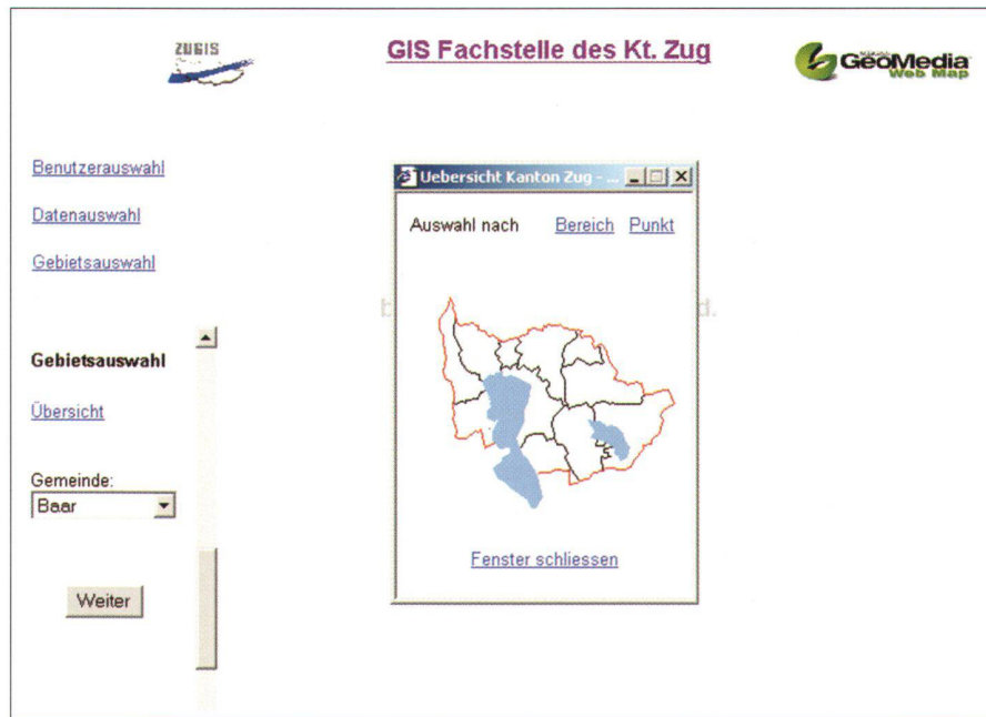
Abb. 4: Gebietsauswahl.