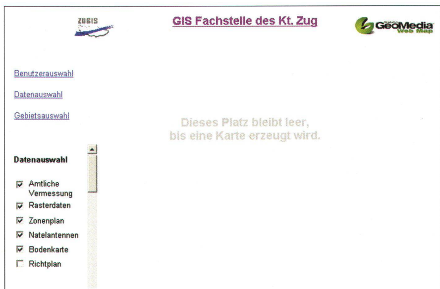
Abb. 3: Datenauswahl.