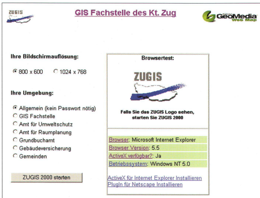
Abb. 2: Benutzerauswahl.