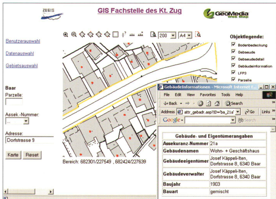
Abb. 5: Attributsanzeige.

Erweiterungen der Funktionalität von GeoMedia Web Enterprise werden von Intergraph (Schweiz) AG im Dienstleistungsverhältnis ausgeführt (zusätzliche Funktionalitäten):