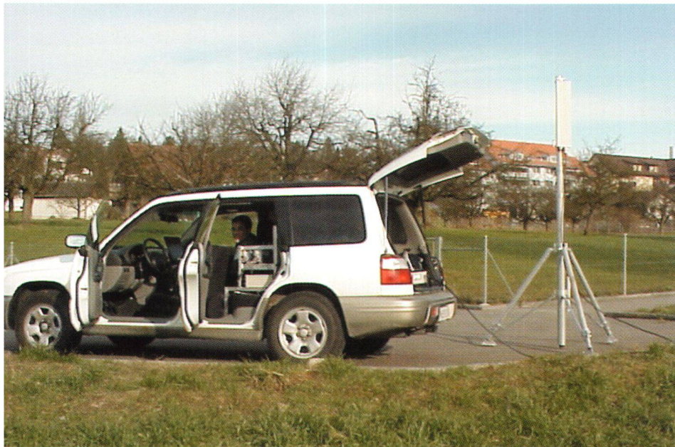
Abb. 8: Messfahrzeug.

Veränderungen eines Namens innerhalb eines bestimmten Zeitraumes. Weiter können Namen zur Beschriftung von Plänen und Karten eingesetzt werden. Swisssnames kann auch im Internet optimal eingesetzt werden: als Portal, zur Su-