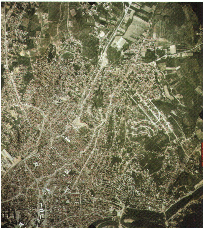
Fig. 1: Ville de Pristina.

Le NPOC (Archives nationales, centre d'informations et de distributions d'images