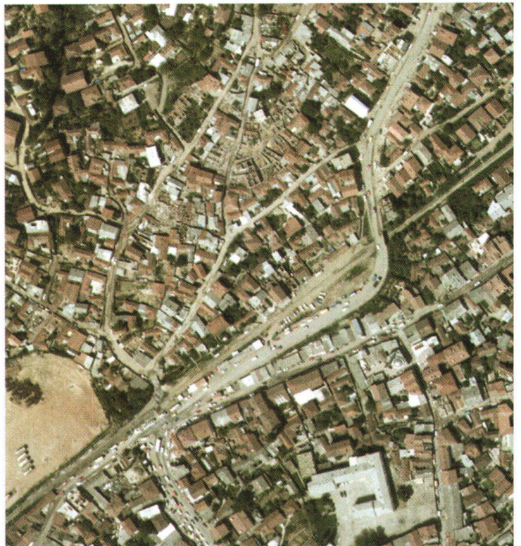
Fig. 2: Ville de Pristina (extrait).