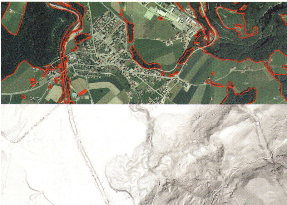
Fig. 5: Produits établis pour la mise à jour des limites de forêts en zones de montagne et de collines (© Office fédéral de topographie 2000).

En 1996, le canton de Berne a réalisé la mise à jour des limites de forêts dans une zone test sur la commune de Trub. Il a été constaté une augmentation de l'ordre de 25% de la surface forestière par rapport aux informations du registre foncier d'autant du début du siècle. Ce problème est particulièrement sensible, vu l'incidence de ces variations sur les paiements directs qui sont de l'ordre de 1600 à 2000 francs par hectare. Toutefois, le cas de la com-