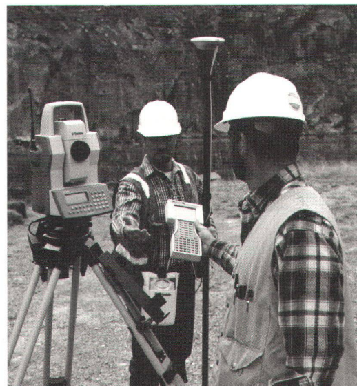
Trimble GPS-Rover 5700 – Robotik-Tachymeter 5600