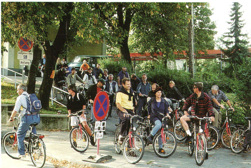
Abb. 2: Die startbereite Radlergruppe am Bahnhof Langenzersdorf nördlich Wiens, im Hintergrund der Begleitbus.

Ein handlicher Faltprospekt mit allen wesentlichen fachlichen Erläuterungen, Tabellen und Bildern inkl. aufgedruckter topographischer Karte mit Radwegkennzeichnung, kann bei der Errichtungsgesellschaft Marchfeldkanal A-2232 Deutsch-Wagram oder solange Vorrat bei rudolf.kuentzel@bluewin.ch bezogen werden. Wienbesuchern empfiehlt sich ein Fahrrad zu mieten, um so in einem halben Tag den Gesamtüberblick zu erhalten.