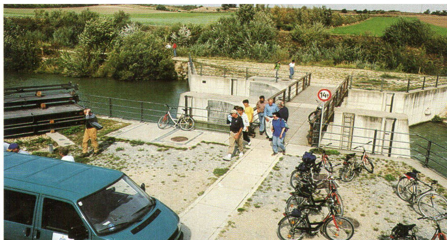
Abb. 4: Wehr bei Stammersdorf. Die Wehr- und Verschlussorgane sowie Pumpwerke werden über ein zentrales Leitsystem vom Betriebshof Deutsch-Wagram aus gesteuert. Links im Bild das Reserveabsperrmaterial, das im Störfall von Hand eingeschoben werden muss. Dank dem durchgehenden Begleitweg können alle Anlagen mit dem Rad oder zu Fuss besichtigt werden.

Diese Frage habe ich mir gar nicht erst gestellt, als ich erstmals von der Reise erfuhr. Da standen eher Gedanken im Vorder-