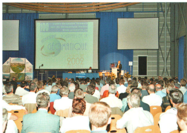
Bilder vom Geomatik-Kongress «100 Jahre Geomatik Schweiz – Geomatik für unsere Zukunft» mit Bundesrat Joseph Deiss im Rahmen der Geomatiktage 2002, 14. Juni 2002, Forum Fribourg.