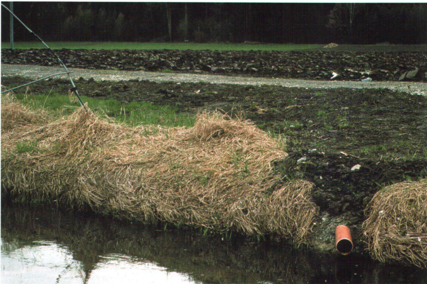
Abb. 2: Beim kulturtechnischen Wasserbau steht die Urbarmachung des Landes längst nicht mehr im Vordergrund. Heute ist die Bodenentwässerung Bestandteil eines integralen Managements des Landschaftswasserhaushalts zur Erhaltung bzw. Förderung ökologischer, wirtschaftlicher und gesellschaftlicher Werte der Landschaft. Dabei müssen nicht nur hydraulische Aspekte berücksichtigt werden, auch die Fragen des Stofftransports im Bodenwasser spielen eine wichtige Rolle.