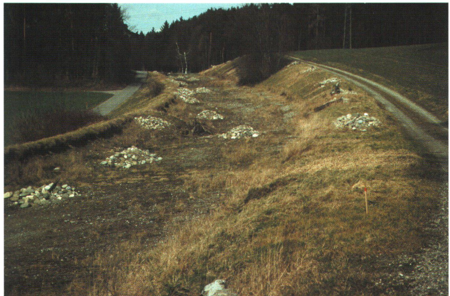
Abb. 1: Die Wiederherstellung von Landschaften wird zu einer immer wichtigeren Aufgabe der Kulturtechnik, um dem Anspruch einer nachhaltigen Landnutzung gerecht zu werden. Das Bild zeigt einen Abschnitt aus dem Rückbau der Kantonsstrasse bei Hettlingen (ZH).

Der Artikel zeigt exemplarisch auf, wie diese Fragen in der aktuellen Forschung und Lehre aufgegriffen werden.