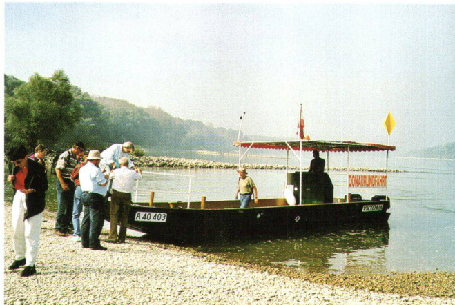
Abb. 4: Donau stromaufwärts bei Haslau-Orth a. Donau. Hinter dem Pontonboot sind die Bühnen sichtbar, die die Fahrrinne einengen und diese besser befahrbar machen.