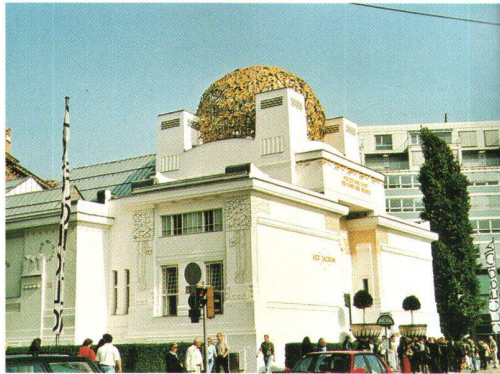
Abb. 3: Die Wiener «Secession», 1898 erbaut. Ein bemerkenswertes «Protestgebäude» des damals 30-jährigen Architekten Joseph Maria Olbrich, wegen der vergoldeten Blattwerk-kuppel vom Volksmund das «goldene Krauthappel» genannt.

ben. Das Einbringen grober Blöcke in der Sohle würde zu rascher Kolmatierung und damit zu einer Unterbrechung des Grundwasserstroms führen. Mit Bühnen und Leitwerken soll zudem die Fahrinne eingeeignet und damit der Niederwasserspiegel angehoben werden. Diese Bauten strukturieren zudem die Landschaft auch im Sinne des Naturschutzes. Der Treppelweg soll mit der Zeit entfernt werden, um die Auen vermehrt zu überfluten. Die Dynamik der freien Fließstrecke bleibt so längerfristig erhalten und die Kosten dafür halten sich in einem vertretbaren Rahmen.