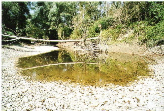
Abb. 5: Flutmulde in den Donau-Auen bei Haslau. Das Restwasser dient den Amphibien als Überlebensstümpel. Entlang der Prallwand werden die Pappeln ausgespült und kippen oft reihenweise, was den Flussnebenarmen zu grosser Dynamik verhilft.

Horizontalfiltersträngen) wurde erstellt, um der einseitigen Abhängigkeit vom Hochquellwasser entgegenzuwirken. Als Ersatzanlage für eine Anlage mit zu kurzen Verweilzeiten beim Filtern soll es nach Fertigstellung ans Netz angeschlossen werden.