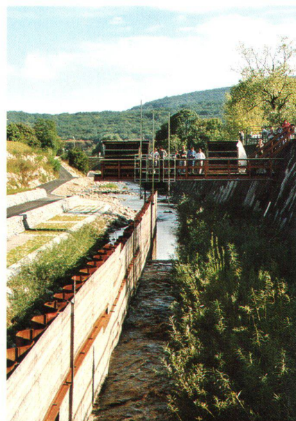
Abb. 2: Die ingenieurbioologische Versuchsstrecke bei Hadersdorf-Auhof am Wienfluss kurz vor der Flutung. Rechts von der Trennwand sind die Grünlagen sichtbar, die bei der Flutung vollständig abgelegt wurden. Im Hintergrund die Messbrücke. Links von der Trennwand sind die zu testenden harten Sohlebauten sichtbar.

Mit 100 000 km 2 Einzugsgebiet (Abfluss durchschnittlich 1400 m 3 , Niederwasser 900 m 3 ; Höchsthochwasser 14 000 m 3 ; Spiegelschwankungen bis 8 m) fliesst die Donau nach Wien durch die einzige freie Fließstrecke in Österreich begleitet von