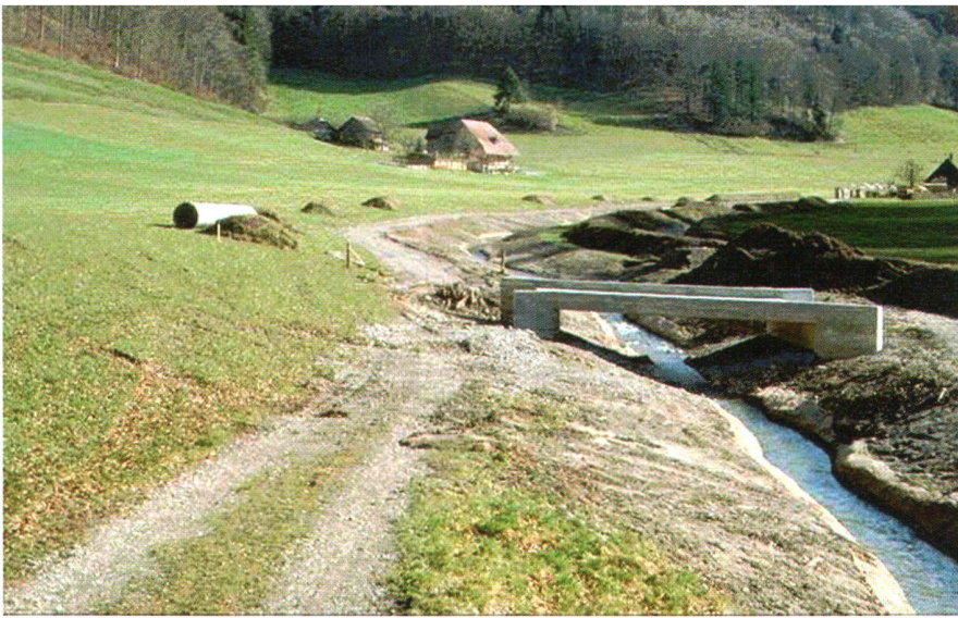
Abb. 3: Multifunktionale Meliorationsmassnahmen: Hochwasserschutz, Bachrenaturierung und Erschliessung für eine rationelle landwirtschaftliche Bewirtschaftung in der Gesamtmelioration Krauchthal (BE). Wer hat welchen Nutzenanteil?

dass die notwendigen Daten ungenügend und uneinheitlich erfasst worden sind. Eine Normierung der Datenerfassung ist deshalb notwendig.