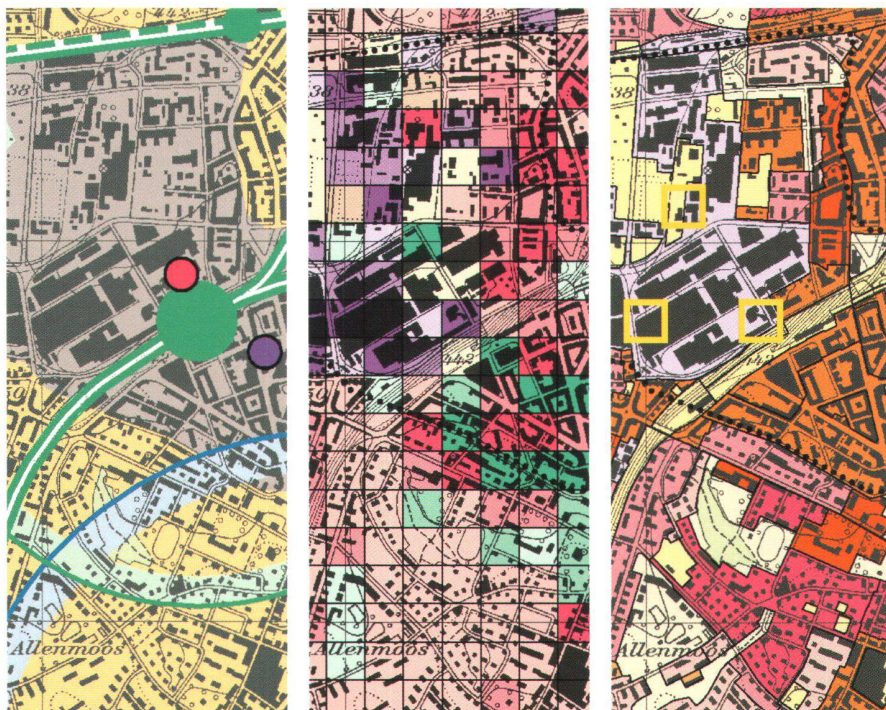
Abb. 3: Raubeobachtung Siedlungsentwicklung: Infrastruktur, Nutzungsintensität, Nutzungsreserven.

in der Verwaltung als alltägliches Instrument eingesetzt werden. Einen sehr grossen Nutzen haben wir bereits mit dem GIS-Browser erzielt, mit welchem Entscheidungsträger wie auch Sachbearbeiter ohne eigentliche GIS-Kenntnisse grundsätzlich von allen Arbeitsplätzen aus auf die wichtigsten Geodaten zugreifen können.