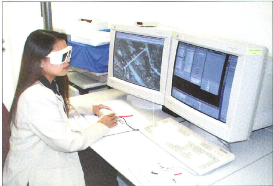
Abb. 4: Digitale Photogrammetrische Workstation LEICA DPW der Landestopographie. Digitales Modell mit teilweise automatischer Auswertung unter ausschliesslicher Verwendung von digitalen Bilddaten.