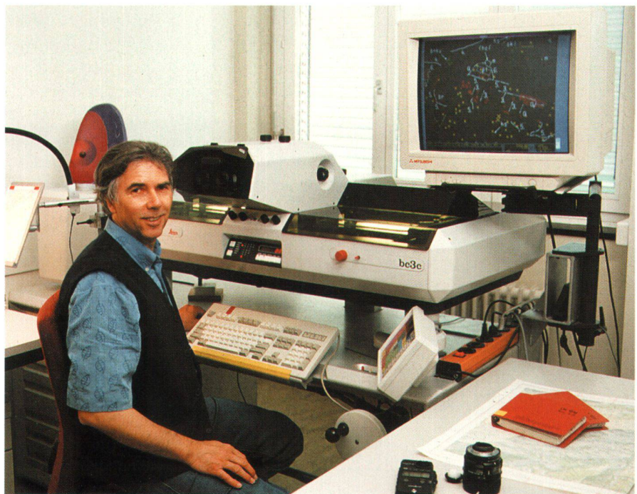
Abb. 3: Analytischer Plotter LEICA BC3 der Landestopographie, noch im Einsatz. Computergesteuertes, optisch-mechanisches Gerät, digitale Auswertung.

Nach dem zweiten Weltkrieg organisierten die Niederlande 1948 den 6. Internationalen Kongress für Photogrammetrie in Den Haag. Dieser brachte neue Impulse und seither wird die Veranstaltung alle vier Jahre durchgeführt. Interessant ist auch, dass 1953 im Rahmen des Marshall-Planes und der OEEC (später umbenannt in OECD) eine spezifische Europäische Organisation für Photogrammetrie, die OEEPE («Organisation européenne d'études de photogrammétrie expérimental») gegründet wurde, mit dem Ziel, die Plangrundlagen für den Wiederauf-