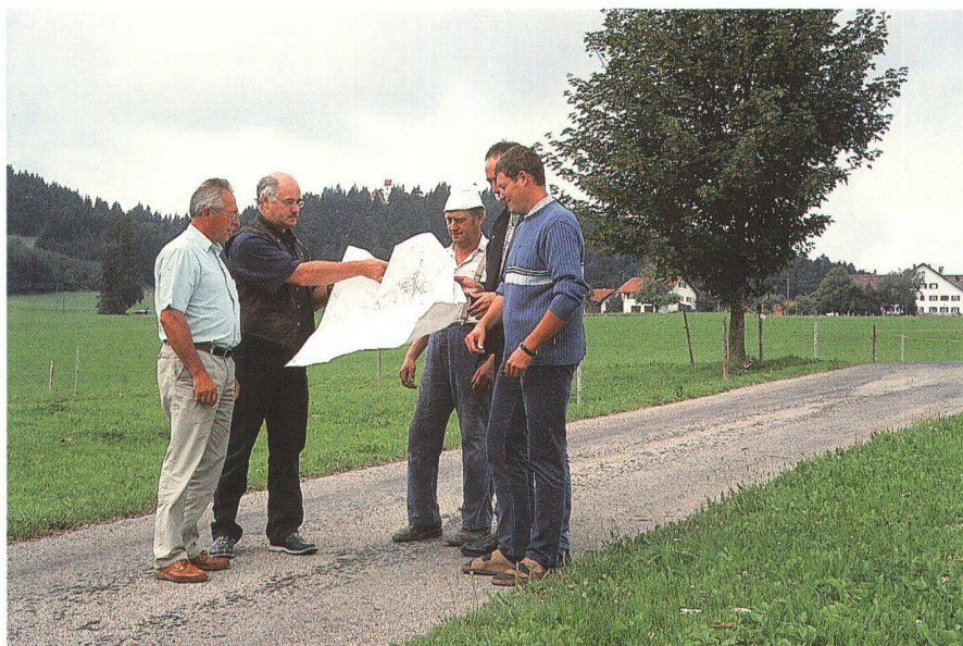
Abb. 2: Bündnispartner und strategische Allianzen: In den Projekten der ländlichen Entwicklung kooperieren Bürger, nichtstaatliche Organisationen und Behörden eng miteinander.

naler und lokaler Ebene. Nachhaltige Dorf- und Regionalentwicklung sei die strategische Antwort auf einen durch wachsende Konkurrenz sich verstärkenden Flächenverbrauch. Laut Hoppe bedeutet der Ausbau der 2. Säule der EU-Agrarpolitik zur Schaffung wettbewerbsfähiger Agrarstruktur eine grosse Chance für die ländlichen Räume. In Brandenburg werde diskutiert, auf Grundlage der EAGFL-Mittelausstattung der derzeitigen Programmphase 2000–2006 die Möglichkeiten der Dorferneuerung zu erweitern und diese mit Bodenordnung und Flurbereinigung zu verknüpfen. Für Reichenbach-Klinke gehört der ganzheitliche Umgang mit der Kulturlandschaft im Sinne der Nachhaltigkeit zum Hauptauftrag der Landentwicklung. Zur Erhaltung der Kulturlandschaft sei weder eine Gesetzesänderung noch eine -erweiterung erforderlich, sondern ein bewusstes Wahrnehmen durch die Akteure.