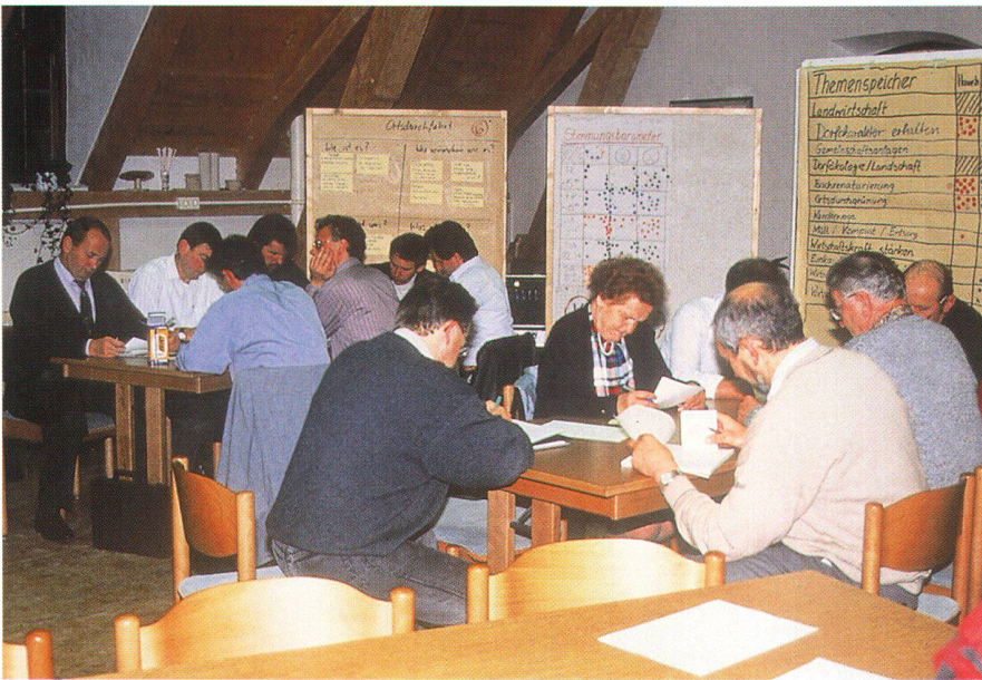
Abb. 1: Nachhaltiges Landmanagement in der ländlichen Entwicklung durch Leitbildarbeit und konzeptionelle Planung.

wanderung fordern, so Krautzberger, dringend konkrete Flächenziele ein. Einziges derzeit wirksames Instrument sei «der goldene Zügel» bei der «rückbauenden» Flächenentwicklung. Diese sehr heiklen Umbauten, zu denen z.B. der Rückbau noch nicht abbruchreifer Bausubstanz oder intakter Infrastruktur zu zählen sei, würden langwierige ablaufende Prozesse mit erheblicher Ressourcenbindung darstellen. Gefragt seien hier umfassende Konzepte und ein schrittweises Vorgehen bei der Umsetzung. Fördermittel sollten nach Krautzberger nur dann eingesetzt werden, wenn die Integration unterschiedlicher Stadtpolitiken gelingt – Stichwort «Soziale Stadt». Zum Baurecht merkte Krautzberger an, dass das europäische Umweltrecht eine Novellierung erforderlich mache. Diese sollte genutzt werden, um insbesondere die Bürgerbeteiligung zu stärken sowie ein Baurecht auf Zeit und damit eine Dynamisierung der Flächenentwicklung zu implementieren.