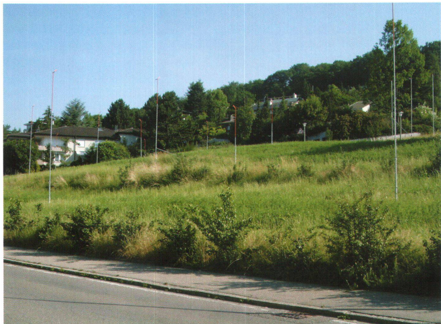
Abb. 3: Kann mit ökonomischen Instrumenten das Bauen auf der grünen Wiese eingedämmt und der Baulandhortung im Siedlungsinne entgegen gewirkt werden?