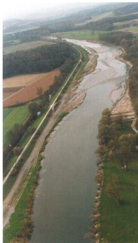
Abb. 2: Wie weit lassen sich die ökologischen Funktionen der Landschaft mit Revitalisierungen wieder herstellen? Entspricht die ökologische Sanierung auch den Bedürfnissen der Bevölkerung?

Das anhaltende Wachstum der Ballungsräume führt zur Frage, wie das Städtesystem der Schweiz in Zukunft aussehen wird. Werden sich kleinere Städte als regionale Zentren behaupten können, oder wird die Dominanz der Metropolitanregionen weiter zunehmen? Ein Projekt entwickelt daher verschiedene Szenarien, die hinsichtlich Flächenverbrauch sowie der wirtschaftlichen und gesellschaftlichen Wünschbarkeit beurteilt werden [8]. Ein