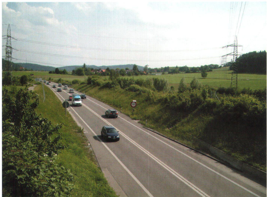
Abb. 1: Wirkt sich die Landschaftszerschneidung, z.B. durch Verkehrsträger, auch auf den genetischen Austausch zwischen verschiedenen Tierpopulationen aus?

Mit diesen Fragen beschäftigt sich die Eidg. Forschungsanstalt Wald, Schnee und Landschaft (WSL) seit 2002 im Rahmen des bis 2006 laufenden Forschungsprogramms «Landschaft im Ballungsraum». Das Forschungsprogramm ist sehr breit angelegt, damit sowohl die naturräumlichen als auch die gesellschaftlichen und wirtschaftlichen Aspekte abgedeckt werden können. Der vorliegende Beitrag will das Spektrum der Forschungsarbeiten aufzeigen und stellt dazu die spezifischen