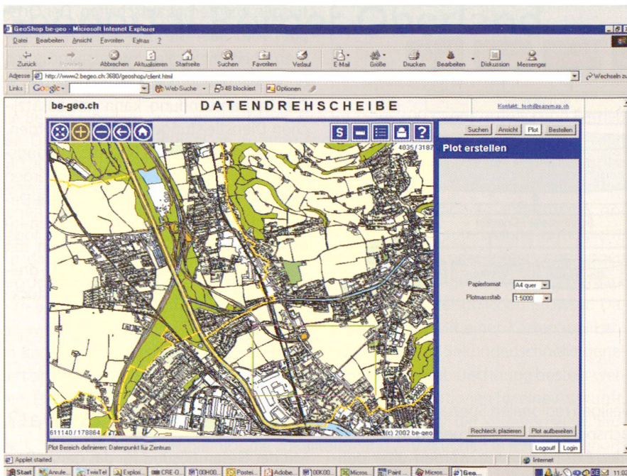
Abb. 3: Gemeinde Heimberg.

formationsdienst aufgebaut. Das System ermöglicht es, auf die speziellen Bedürfnisse einzelner Gemeinden einzugehen und zukünftige Entwicklungen zu integrieren. Die Daten der Amtlichen Vermessung als Basis erlauben das Erstellen eines Produktes von höchster Aktualität und Genauigkeit. Die Daten werden damit in ihrer ganzen Breite für die Allgemeinheit nutzbar gemacht. Insbesondere kann durch die Anwendung von Internettechnologien auf teure Spezialsoftware zur Abfrage und Visualisierung verzichtet werden.