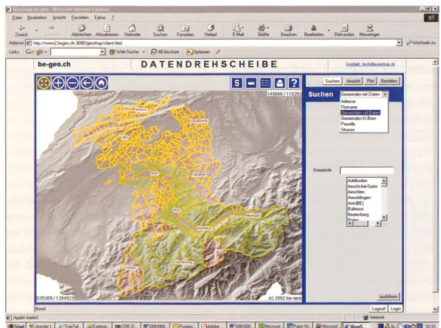
Abb. 4: Geoportail Berner Oberland. Grün: Gemeinden auf der Datendrehscheibe (Stand Dez. 2003).

Mit dem Beitritt von starken Vertretern aus der Region Bern und dem Seeland/Jura konnte eine wichtige Erweiterung verzeichnet werden. Die technische Lösung, der modulartige Aufbau der verschiedenen Produkte und die damit verbundene Ausbaufähigkeit sowie der kostengünsti-