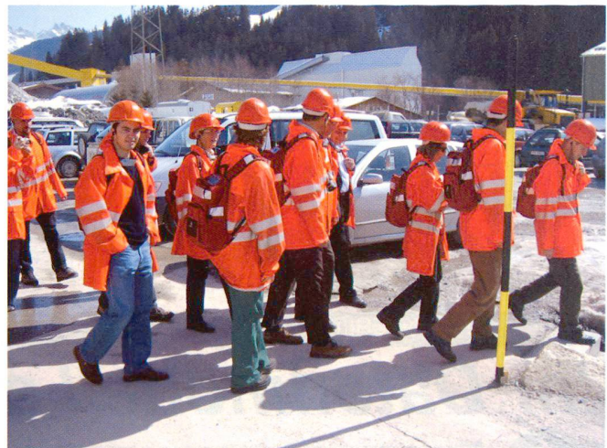
Abb. 5: Exkursionsteilnehmende auf dem Weg zum Schacht Sedrun.