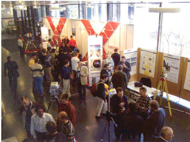
Abb. 2: Ein Blick in die gut besuchte Firmenausstellung.