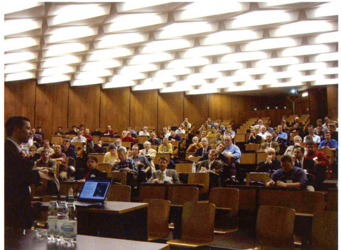
Abb. 3: Das aufmerksame Publikum während einer der Vortragssessionen.