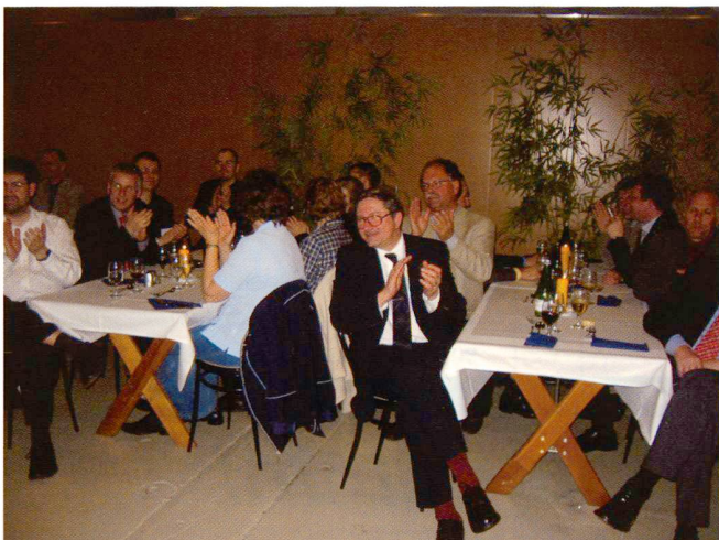
Abb. 4: Heitere Stimmung bei der Abendveranstaltung.

Die erste Hälfte vom Nachmittag des vierten Kongresstages widmete sich Session 3a (Monitoring und Ingenieurnavigation). Martin Funk (ETH Zürich) versuchte, die