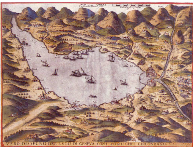
Fig. 1: Luca Bertelli et Franco, Vero disegno del lago di geneva, eau-forte aquarellée, 1585–1589, Musée historique, Lausanne.