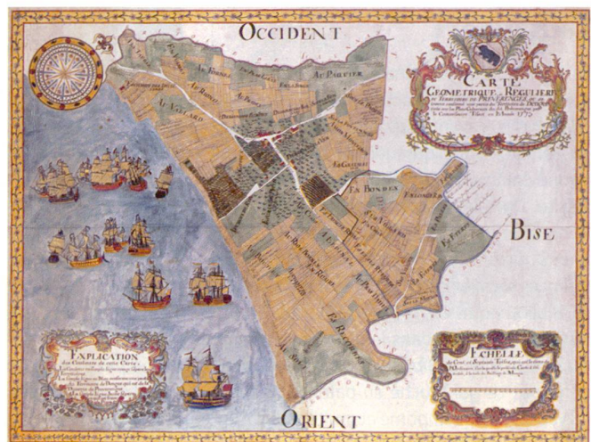
Fig. 2: Commissaire Tissot, Carte géométrique et régulière du territoire de Prévêrance, dessin aquarellé, 1773, Archives cantonales Vaudoises.