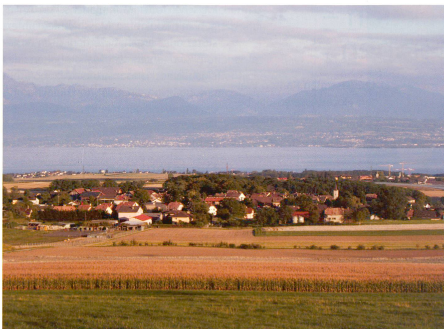
Fig. 2: Lavigny (VD).

mique (montage financier). Il ne doit pas figer un état futur, mais au contraire être prospectif et contribuer à la maîtrise, par la collectivité locale, des situations présentes et futures. Il doit bien évidemment inclure l'espace agricole, à défaut de quoi l'agriculture sera la grande perdante de l'opération, trop souvent réduite alors à ce qui reste quand on a fait tout le reste. Elaborer un tel projet n'est toutefois pas œuvre facile! Cela nécessite d'apporter des réponses à des questions de société aussi fondamentales que: quelle agriculture voulons-nous, ou quel paysage souhaitons-nous?