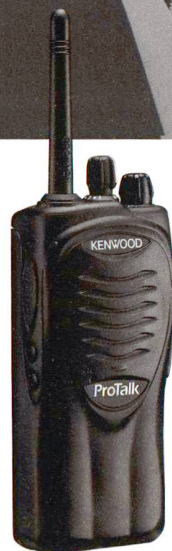
NEU ProTalk TK-3201

Klare Verständigung garantiert beste Teamarbeit!