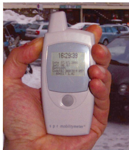
Fig. 1: L'appareil Mobility Meter.

Principalement depuis le début des années 50, le recueil des déplacements d'une population donnée s'effectue sur la base d'un système déclaratif (les systèmes automatiques de comptage ne permettent pas de différencier les informations obtenues par groupe de population). Deux variantes principales sont utilisées. La première consiste à demander à un échantillon de la population de reporter à la main tous les trajets effectués la veille de l'interview sur des cartes d'une ville ou d'une agglomération. L'autre variante, plus moderne et mise en pratique depuis les années 80 consiste à interroger par téléphone un échantillon