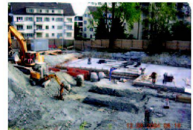
Bei schweren Baumaschinen: Immer Helm auf!