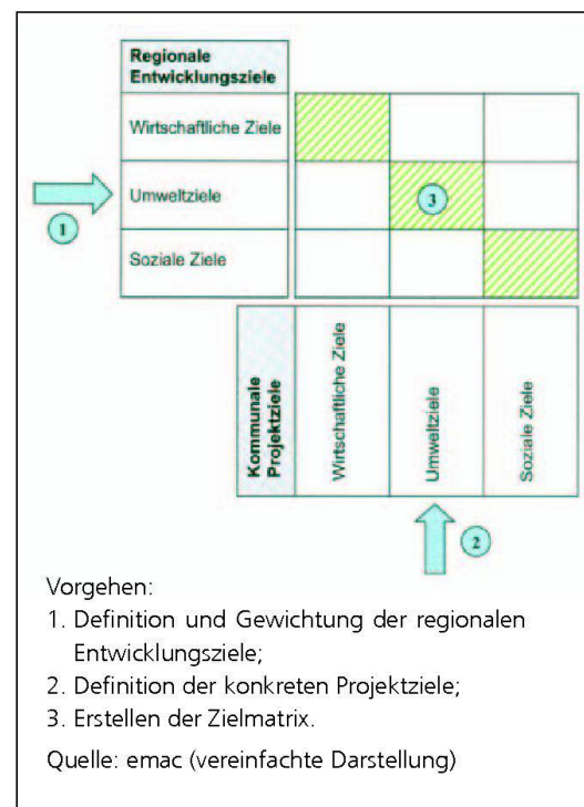
Abb. 4: Zielbeurteilungsverfahren.

Die Erkenntnisse aus den Forschungsarbeiten und den Pilotprojekten bilden die Basis für die Ausgestaltung der Ausführungsbestimmungen zu Art. 93 Abs. 1 Bst. c LwG. Die Umsetzung erfolgt im Rahmen des laufenden Reformprozesses zur Agrarpolitik 2011 und wird Anpassungen in der Strukturverbesserungsverordnung bedingen. Dabei werden verschiedene Anforderungen und Bedingungen festzulegen sein, insbesondere betreffend lokale Initiative, vorwiegend landwirtschaftliche Beteiligung, Wertschöpfungspotenzial, Wirtschaftlichkeit nach Abschluss der öffentlichen Unterstützung, Abstimmung und Koordination mit der Regionalentwicklung und integrales Konzept der Massnahmen. Parallel zur Umsetzung von Art. 93 Abs. 1 Bst. c LwG wird im Rahmen der Agrarpolitik 2011 auch der Vorschlag aus der Regionsanalyse aufgegriffen und konkre-