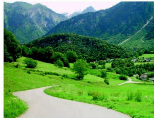
Abb. 1: Ponto Valentino, Bleniotal.

L'entrata in vigore della Politica agricola 2007 offre nuove opportunità alle aree rurali. Conformemente all'articolo 93 capoverso 1 lettera c LAgr, i progetti di sviluppo regionale ai quali l'agricoltura partecipa in modo preponderante possono essere sostenuti finanziariamente mediante i contributi previsti per i miglioramenti strutturali. Non sono tuttavia ancora state elaborate disposizioni per l'esecuzione di questo nuovo principio di promozione. Per tale motivo l'Ufficio federale dell'agricoltura (UFAG) ha commissionato due lavori di ricerca e lanciato due progetti pilota. L'analisi regionale (studio delle interconnessioni macroeconomiche in una regione periferica come la Valle di Blenio nel Canton Ticino) e l'analisi dei bisogni (esame delle migliorie integrali attuate nella Bassa Engadina con lo scopo di individuare i bisogni della regione)