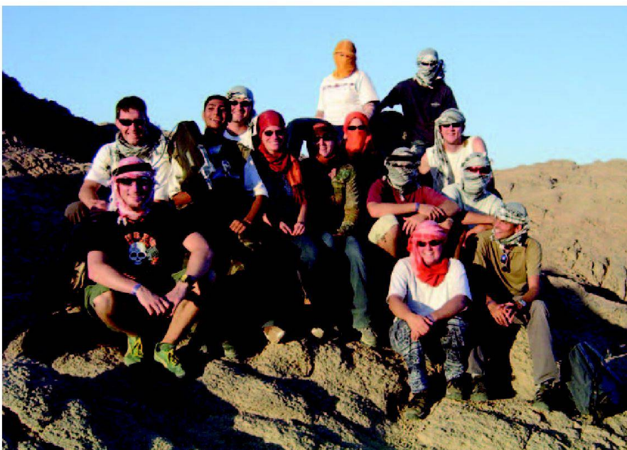
Abb. 1: Geomatik-Abschlussklasse FHBB 2005 in der ägyptischen Wüste.

sind wichtige ägyptische Ministerien (Landwirtschaft, Landesvermessung, Geografie, Institut für Wüstenforschung, Institut für Entwicklung und weitere), verschiedene Universitäten und die Entwicklungsorganisationen UNCED (United Nation Conference on Environment Development). Das Informationssystem soll als Werkzeug zur Entscheidungshilfe und zur Planung von natürlichen Ressourcen für Entscheidungsträger dienen. Auch soll es GIS-technisch weniger versierten Personen, der unteren und mittleren Entscheidungsebenen, den direkten Zugang zu den Daten er-