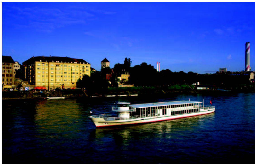
MS Christoph Merian.