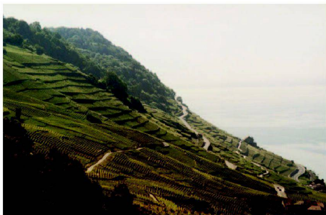
Abb. 3: Typ I: Rebterrassenflur Lavaux.