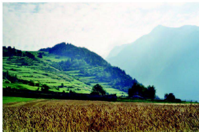
Abb. 4: Typ I: ehemalige Ackerterrassenflur Ramosch.