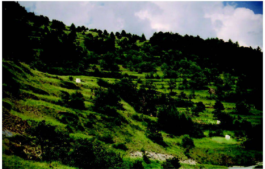
Abb. 5: Typ II: ehemalige Ackerterrassenflur Erschmatt.

Der Perimeter des Typs II ist durch kulturgeschichtliche, d.h. nutzungsbedingte sowie naturräumliche Ähnlichkeiten bestimmt. Die Rebterrassenflur Ribe in Visperterminen könnte als Teil der Terrassenlandschaft «vorderes Vispertal und Saastal» angesehen werden, da die genannten Täler von ähnlichen kulturgeschichtlichen sowie naturräumlichen Aspekten gezeichnet sind. Gleiches könnte