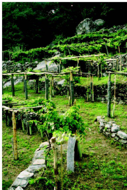
Abb. 6: Typ III: Rebterrassenflur Bassa Valle Maggia.

eine grössere ehemalige Ackerterrassenflur von ca. 10 ha (Budmiger 1970: Plan Nr. 3)