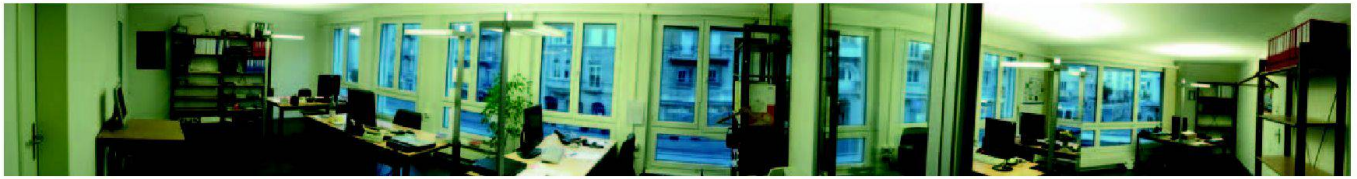
Teilbereich der neuen ESRI Büroräumlichkeiten.

tuell sind in der ESRI-Niederlassung in Zürich 19 und in Nyon fünf MitarbeiterInnen tätig, die zusätzlich von Deutschland unterstützt werden.