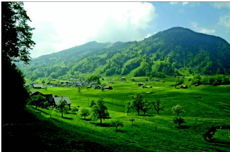
Abb. 1: Sommerlandschaft Sattel.