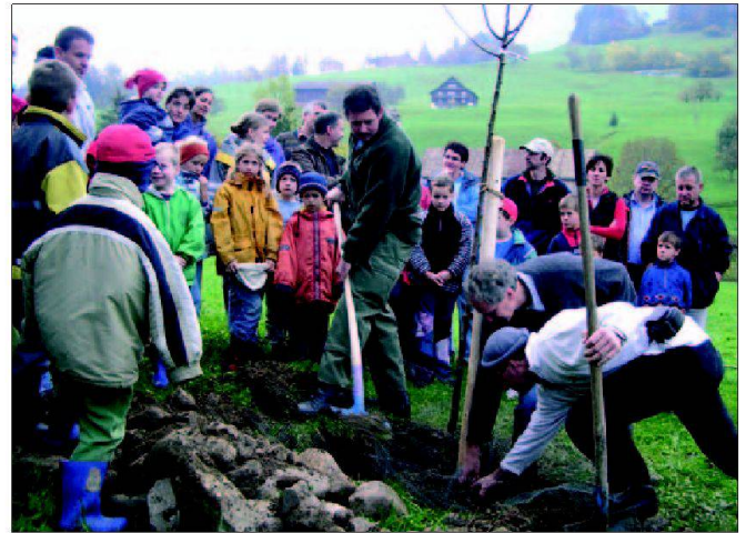
Abb. 5: Pflanzaktion am Obstbaumtag 2004.

pressaktion stiessen auf reges Interesse. Den Rahmen rundete die Festwirtschaft mit Musik aus dem Dorf ab.