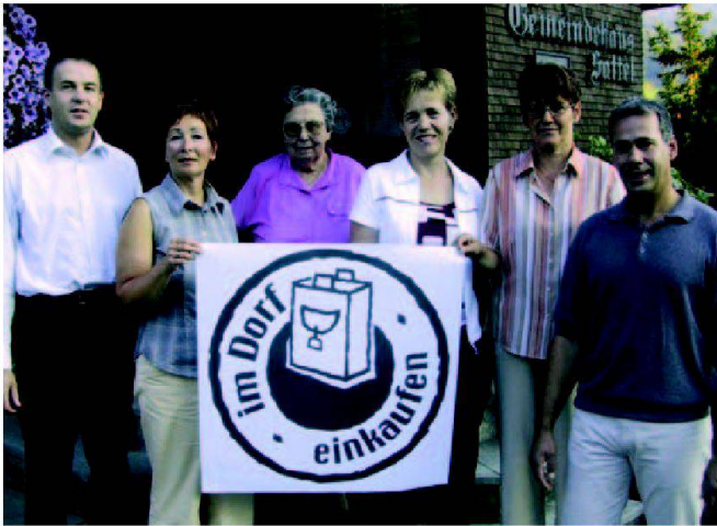
Abb. 4: Initianten der Aktion «Einkaufen im Dorf».