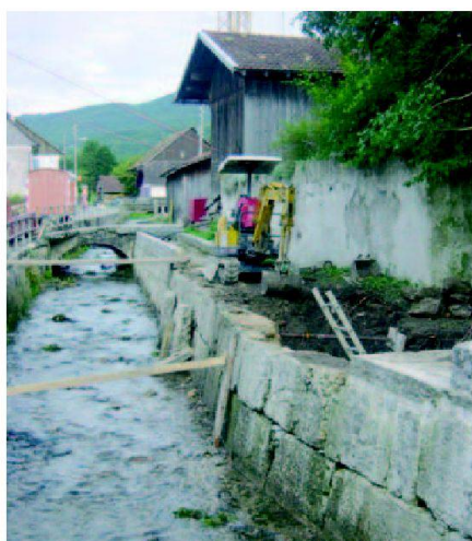
Fig. 5: Canal en rénovation.

Yves Leuzinger lic. es sciences et ingénieur environnement HES bureau Natura animateur du projet Soulce Saucy 17 CH-2722 Les Reussilles BE leuzinger@bureau-natura.ch