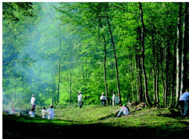
Fig. 4: Des jeunes de classes scolaires au travail pour gérer le bocage.

nant compte de l'intégration paysagère dans le site et un projet de mise en réseau selon l'OQE est dans sa phase finale d'approbation. Ces projets en cours complètent les actions déjà entreprises, résumées dans le tableau ci-joint.