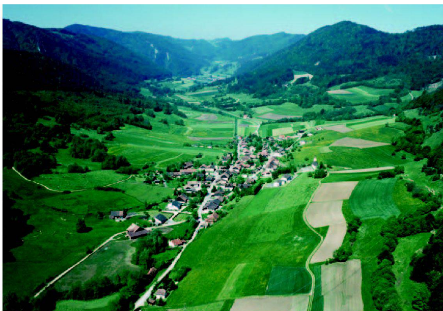
Fig. 1: Vue générale du vallon de Soulce.

Le projet est regroupé en thèmes, les grands domaines de la planification paysagère, dans lesquels des actions particulières sont décrites. Ces actions sont mises en application en fonction de priorités