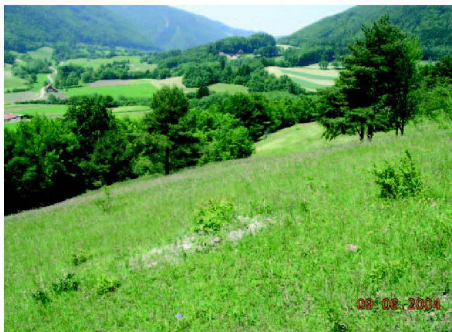
Fig. 3: Une prairie maigre entretenue et le système bocager très riche: une garantie de biodiversité.