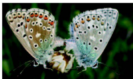
Fig. 6: Les papillons, un bon indicateur pour le suivi d'efficacité du travail sur les prairies.