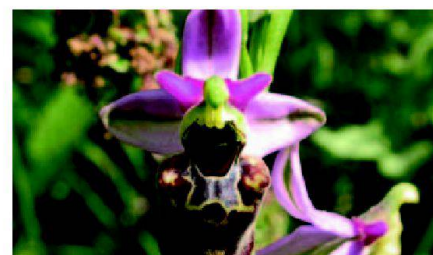
Fig. 7: Les orchidées, trésor de Soulce, avec 23 espèces et des milliers de pieds.