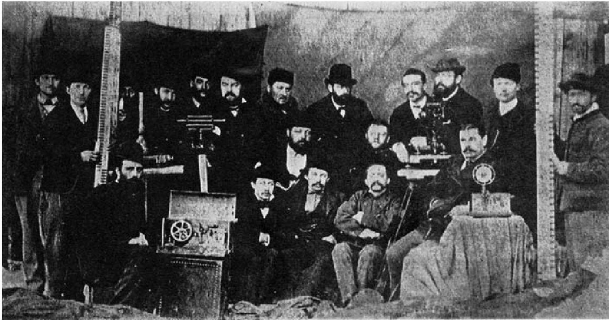
Abb. 1: Die Vermesser am Gotthard-Bahntunnel.