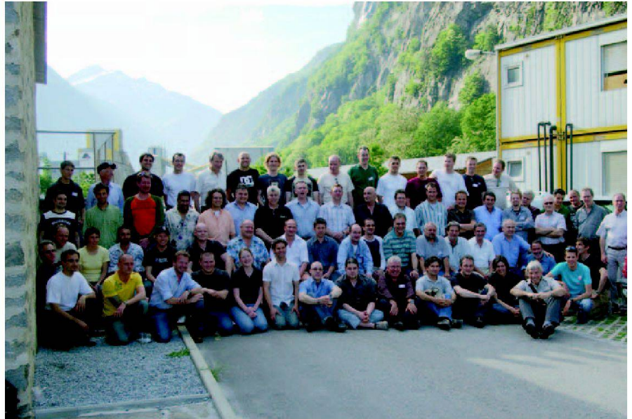
Abb. 5: Die Vermesser am Gotthard-Basistunnel 2006.

Beim GBT erhält der Unternehmer im Abstand von 420 m Hauptabsteckungspunkte, wobei der vorderste Punkt nicht mehr als 1300 m hinter der Stollenbrust liegen darf. Die Absteckung erfolgt nicht mehr mit Alignements, sondern mittels übergreifenden Polygonzügen, die syste-