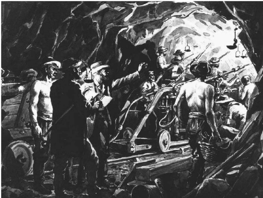
Abb. 3: Bohrarbeiten am Gotthard-Bahntunnel.

weichung meinte er, dass «eine solche nicht stattfindet, weil die Gipfelmassen zu beiden Seiten des Passes zu unbedeutend seien gegenüber der Anziehung der ganzen Gebirgsmasse».