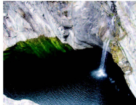
Abb. 1: Klippenspringer-Weltmeisterschaften in der Maggia.

Brontallo ist ein typisches, malerisches und intaktes Tessinerdörfchen auf einer Meereshöhe von 720 Meter, vor wärmespeichernden Felsen auf einer Terrasse an einem Südhang des hinteren Maggiatales gelegen. Es ist im Bundesinventar der schützenswerten Ortsbilder der Schweiz