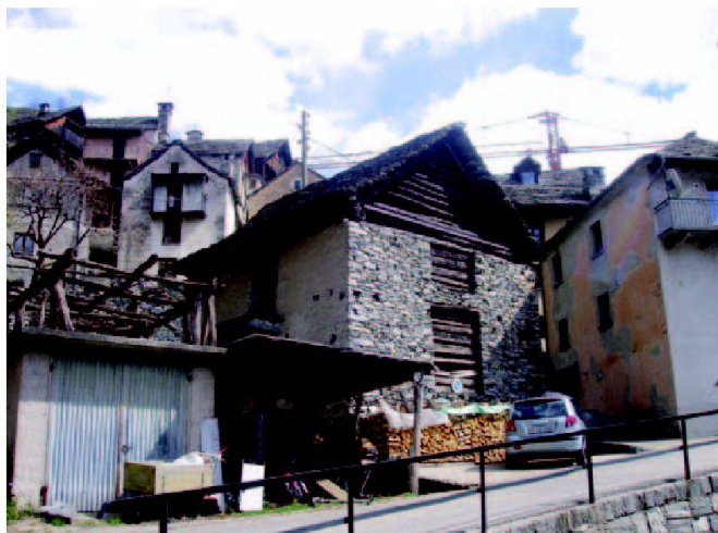
Abb. 6: Ein Stall wird als Weinkeller und Verkaufsladen für typische Tessinerprodukte umgebaut werden.