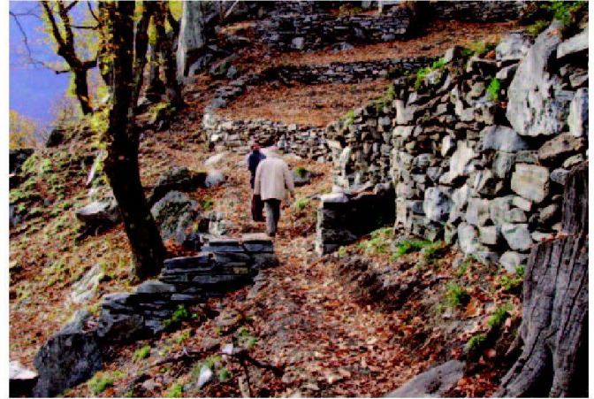
Abb. 3: Revitalisierter Kastanienhain mit Trockenmauern und vorgesehenem Lehrpfad.

rung von einheimischen und regionalen Produkten basiert auf folgenden Gründen: