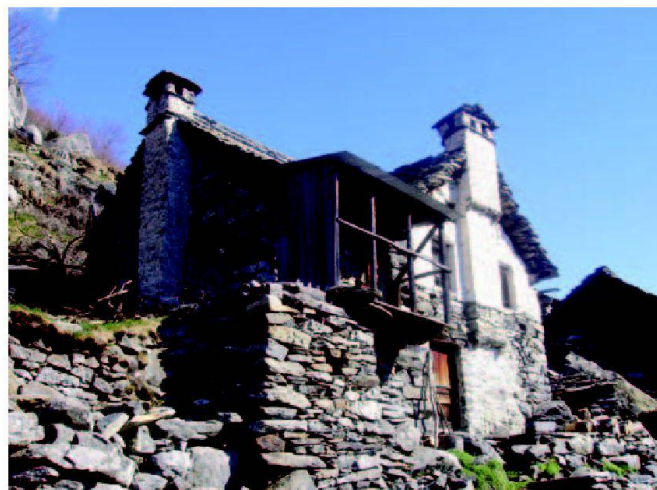
Abb. 7: Geplanter Umbau eines «Rustico» auf einem Monti für den Agrotourismus.