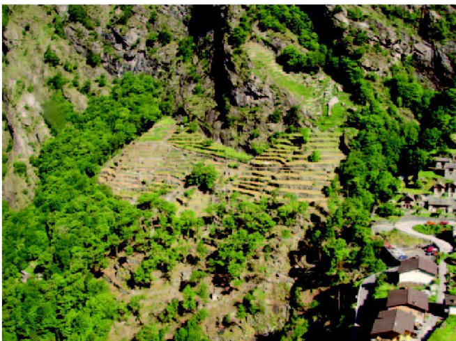
Abb. 4: Rebhang beim Dorf, geschützt durch wärmespeichernde Felswände.