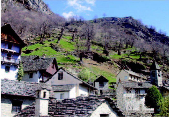
Abb. 2: Brontallo, malerisches Tessinerdorf mit Kastanienhainen.