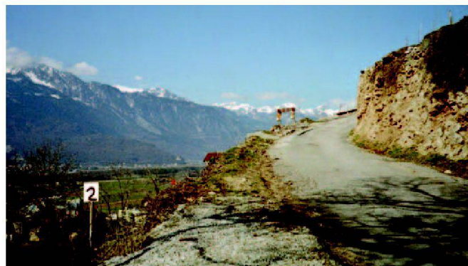
Fig. 2: Chemin no 1, accès vers les Hauts du syndicat.