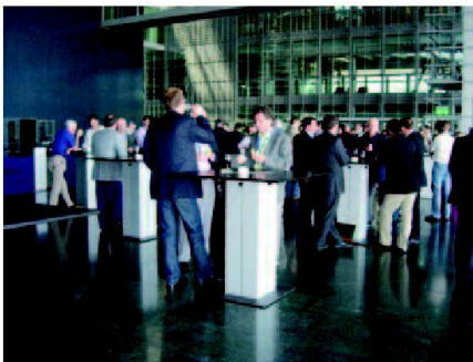
Lunch auf der KKL-Terrasse.