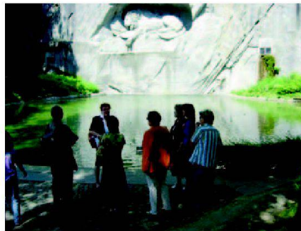
Stadtführung in Luzern.