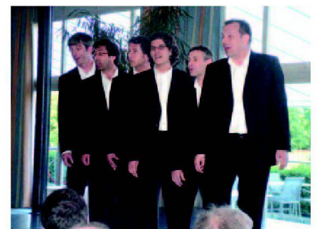
Nachtessen im Hotel Casino: A Capella Ostinato.