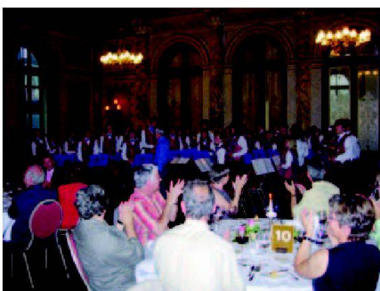
Bankett im Hotel Schweizerhof mit Jugendblasorchester.