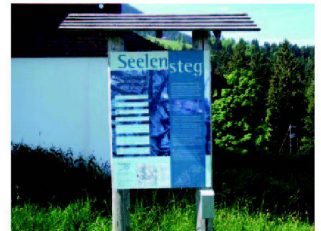
Ausflug in die Biosphäre Entlebuch.