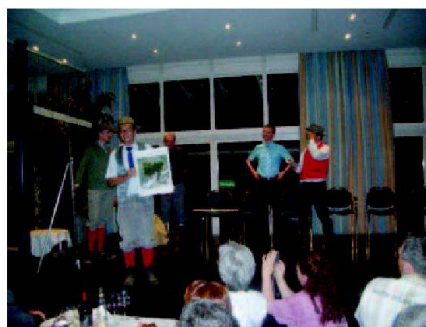
Nachtessen im Hotel Casino: Vermessung in Aktion.