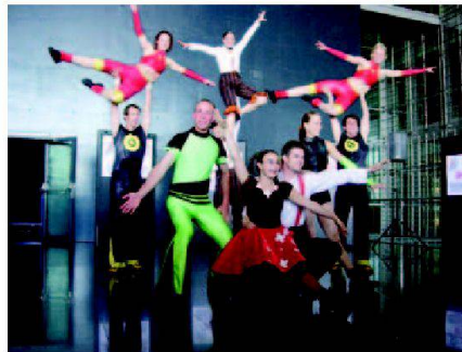
Let's move: Rock'n'Roll Club Sixteen Luzern.