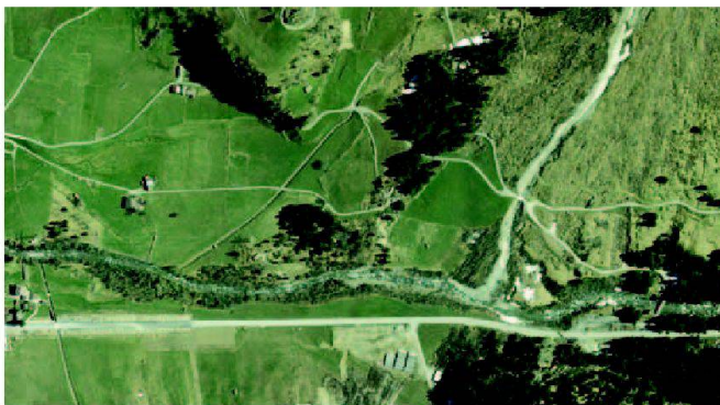
Abb. 2: Der Aarelauf und die Strasse oberhalb Guttannen vor dem Ereignis.

halten und das Dorf wurde am 22. August von der Aare überschwemmt. Als Sofortmassnahme musste für die Aare ein neues Bett gegraben und eine Notstrasse zur Sicherstellung des Zugangs zu den Kraftwerkenanlagen der KWO gebaut werden (Abb. 4). Nach der Befliegung vom 23. August wurden die Luftbilder noch in derselben Nacht orientiert und ausgewertet. Damit standen zur Planung und Ausführung dieser riesigen Erdarbeiten bereits am 24. August die photogrammetrischen Daten der neuen Topographie und die Mächtigkeit der Schutt- ablagerung bereit. Ähnliche Beispiele wären aus Brienz, dem Diemtig- und dem Lüttschental zu zeigen.