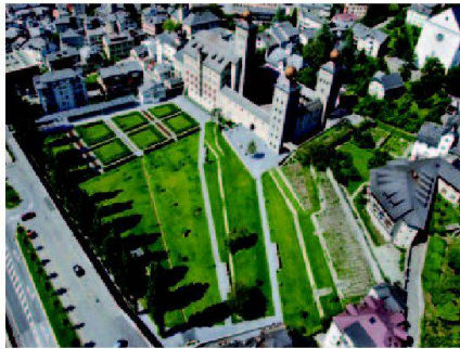
Brig, Stockalperscher Schlossgarten.

Der diesjährige Denkmaltag mit dem Motto «Gartenräume – Gartenträume» bietet am 9. und 10. September 2006 die Gelegenheit, sich