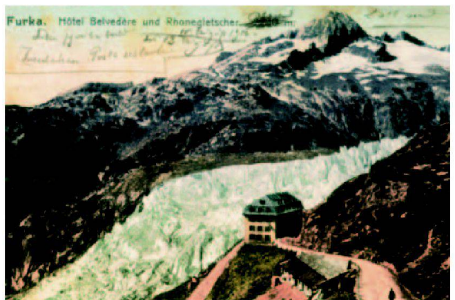
Der Rhonegletscher gehörte schon im 18. Jahrhundert zu den Attraktionen des frühen Alpentourismus.

1. September 2006 – 25. März 2007 Mo 14–21 Uhr, Di–So 10–17 Uhr Schweizerisches Alpines Museum, Bern Helvetiaplatz 4, 3005 Bern Tel. 031 350 04 40, Fax 031 351 07 51 www.alpinesmuseum.ch