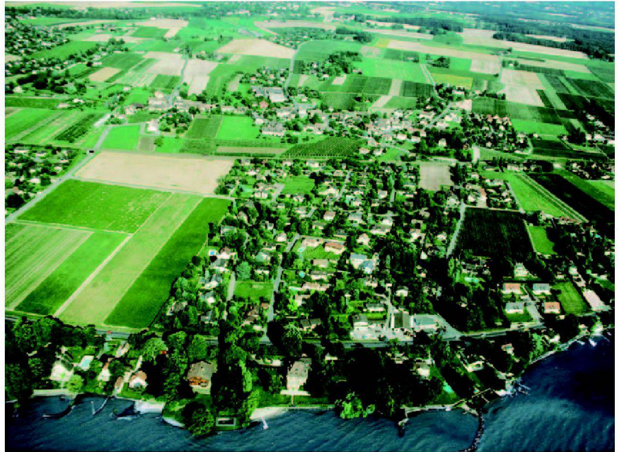
Abb. 1: Zersiedelung der Landschaft.

Je disperser die Siedlung sich entwickelt, desto aufwändiger werden Bau und Betrieb von Infrastrukturanlagen. Weitläufigere Netze, längere Distanzen, Versorgung einer unterkritischen Masse in dünn besiedelten Gebieten machen die Erstellung und Erneuerung der Anlagen sowie die Versorgungsleistungen nicht nur teurer, sondern erfordern auch bedeutend