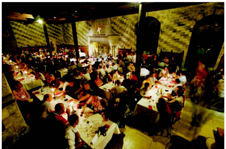
Fig. 6: Repas au Château de Chillon.