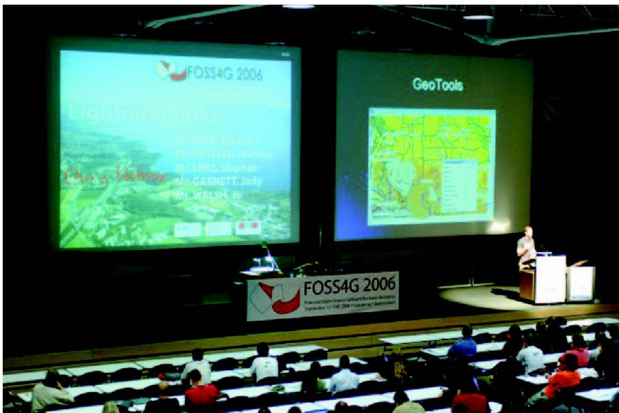
Fig. 5: Séance en plénum.

Les communautés suivantes étaient représentées: