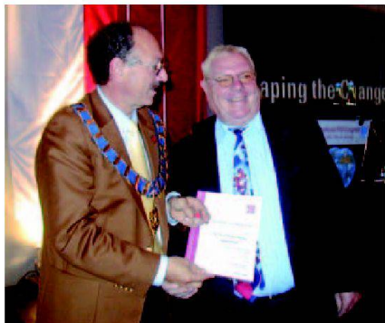
FIG-Ehrenmitglied: Jürg Kaufmann

Am FIG-Kongress vom 8. bis 13. Oktober 2006 in München wurde geosuisse-Präsident Jürg Kaufmann von der General Assembly für seine Verdienste um den Cadastre 2014 zum Ehrenmitglied gewählt. Der Bericht «Cadastre 2014» der FIG-Kommission 7 wurde inzwischen in 25 Sprachen übersetzt. Cadastre 2014 wird in vielen Ländern diskutiert und teilweise umgesetzt.