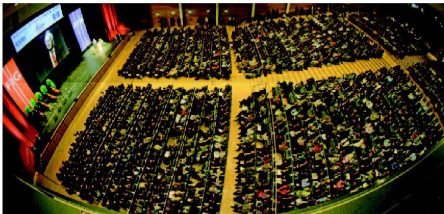
Abb. 1: Eröffnungsfeier FIG-Kongress und Intergeo 2006 in München.