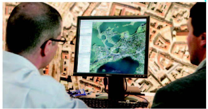
Abb. 2 und 3: Intergo 2006.

nen mit schrumpfenden Städten und Dörfern. Wenn auch der bayerische Ministerpräsident Stoiber mit Stolz auf das durchschnittliche Pro-Kopf-Einkommen von rund 40 000 US-Dollar in Bayern hingewiesen habe, lebe ein Grossteil der Menschen in Armut mit Einkommen von unter 350 US-Dollar pro Kopf und Jahr. Trotz der gewaltigen Aufgaben verbreitete Töpfer Optimismus. Geomatik und Landmanagement nannte er die Basis von Entwicklung und Frieden in der Welt. Mit Blick auf aktuelle Konflikte in der ganzen Welt zitierte er: «Zerstöre die Kataster und ihr beschwört einen Krieg herauf». Mit diesen anschaulichen Worten trug er der Arbeit und der Verantwortung der Geomatiker Rechnung. Im kommenden Jahr lädt der Deutsche Verein für Vermessungswesen (DVW) zur 13. Intergo vom 25. bis 27. September 2007 in die Leipziger Messe ein. Parallel findet der 55. Deutsche Kartographentag statt. Die FIG Working Week 2007 wird in Hongkong durchgeführt.