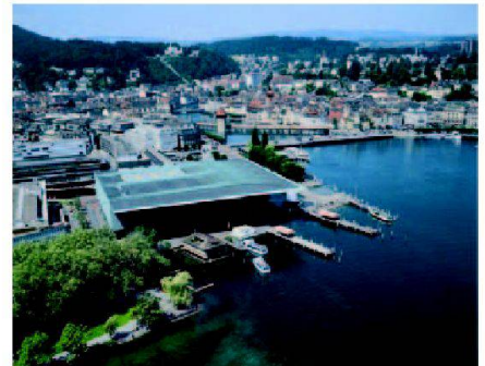
Luzern mit KKL.