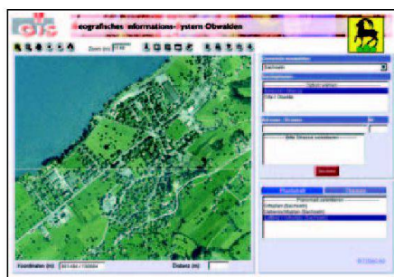
Abb. 4 und 5: Zwei Ansichten der Geodaten-Viewer von LIS Nidwalden (links) und GIS Obwalden (rechts).