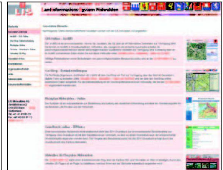
Abb. 2 und 3: Startseite der Homepage von GIS Obwalden (links) und Überblick über die Geodaten-Dienste auf der Homepage von LIS Nidwalden (rechts).

folgte ab 1996 durch eine Aktiengesellschaft, die LIS Nidwalden AG. Deren Aktionäre sind der Kanton Nidwalden, die elf Gemeinden sowie Werke und Private wie z.B. das Elektrizitätswerk Nidwalden (EWN). Aktionärsbindungsverträge regeln insbesondere die Standards betreffend Datenabgabe, -integration und -austausch zwischen den Beteiligten. Die Aktiengesellschaft bedient sich für die operativen GIS-Aufgaben einer privatwirtschaftlichen Geschäftsstelle (vgl. [4], [6]). Die Beiträge der Partner bewegen sich in ähnlicher Grössenordnung wie beim Nachbarkanton Obwalden.