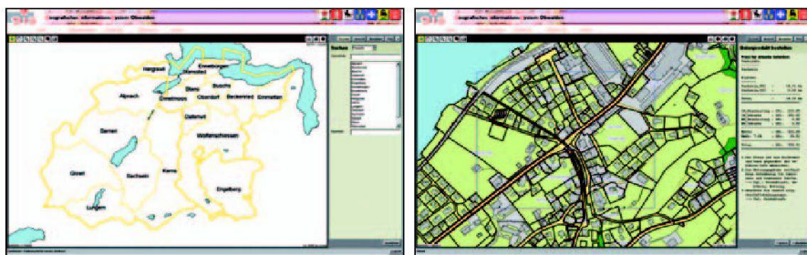
Abb. 6 und 7: Der Geodaten-Shop von GIS Obwalden: Einstiegsseite nach dem Login (links) und Bestellmaske mit Preiskalkulation (rechts).

zungen direkt für ihre Planungen übernehmen können.